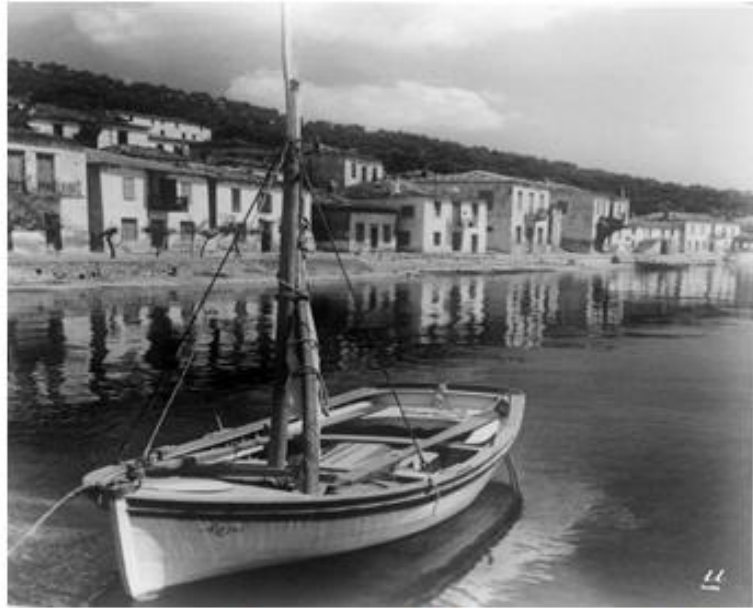
1950 Άφησος