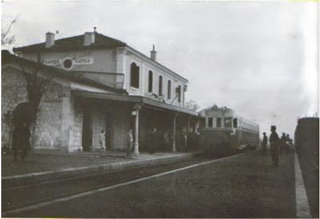
1950 Σιδηροδρομικός σταθμός Λάρισσας