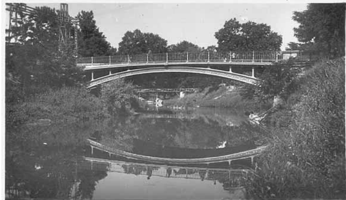
295-2. ΤΡΙΚΑΛΑ. Ἡ κεντρικὴ γέφυρα